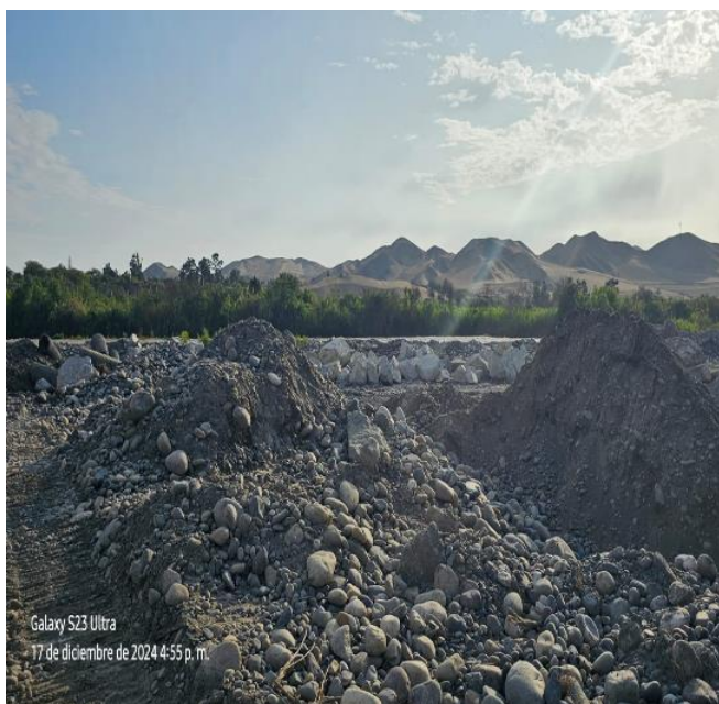
FOTOGRAFIA 02: Vista en la que se aprecia la carencia de diques secos con acumulacion de material propio en ambas margenes del río.