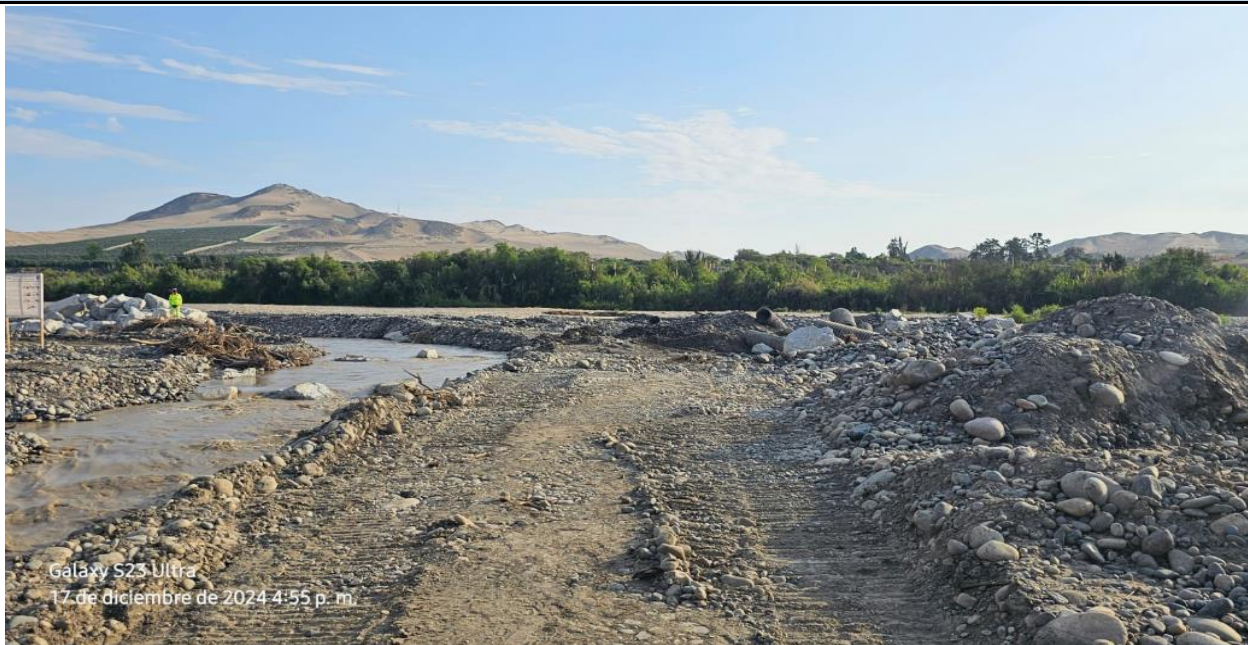
FOTOGRAFIA 01: Vista en la que se aprecia el cauce del río el cual se encuentra colmatado, producto de las avenidas extraordinaria